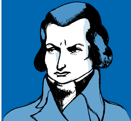
Victor Hugo (1802-1885). Frantziar idazlea.

« Mundua gidatzen dutenak eta herrestan daramatenak ez dira makinak, ideiak baizik »