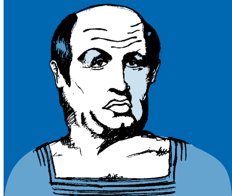
Seneka (Ka 4 - Ko 65). Latindar filosofoa.

« Aurkitu diren gauzez denok gogobeterik sentituko bagina, ez litzateke inoiz ezer berririk asmatuko »