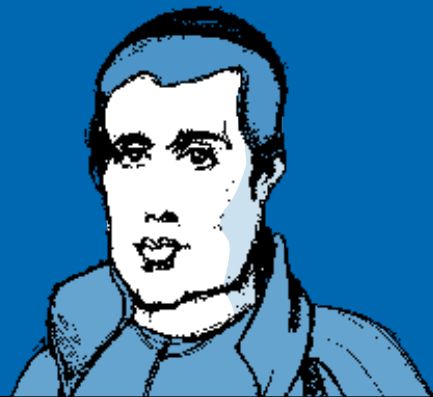
Jaime Balmes (1810-1848). Espainiar filosofoa.

« Irakurtzea elikatzea bezalakoa da; ateratzen den probetxua ez da jaten denarekin neurtzen, digeritzen denarekin baino »»