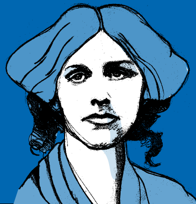
Louise M. Alcott (1832-1888). Estatubatuar idazlea

« Liburu on bat da jakin-minez zabaltzen dena eta onuraz ixten dena »»