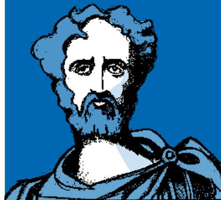
Kaio Plinio (63-113 aldera). Latindar idazlea.

« Ez dago liburu guztiz txarra denik, beti baita zerbait ona ikas daitekeenik »