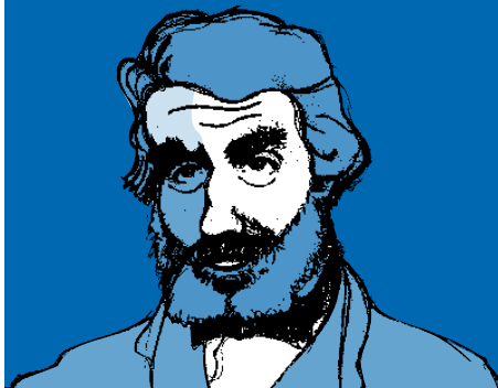
Thomas Carlyle (1795-1881).

« Gizadiak eginiko, pentsaturiko, lorturiko guztiak eta gizadia izan den guztiak iraun egiten du, liburuen orrialdeetan miragarriro gorderik »