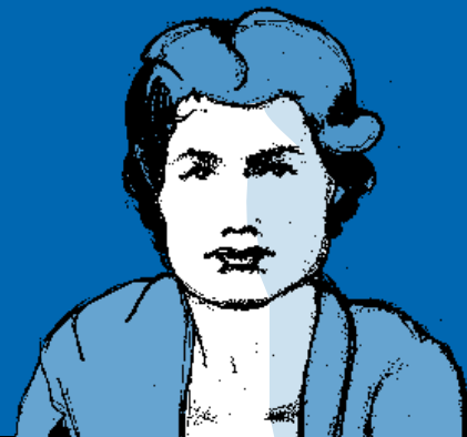
Doris Lessing (1919an jaioa). Britainiar idazlea

« Talentua zerbait ohikoa da. Buruargitasuna ez da gaitasun urria, baizik eta jarraitutasuna »