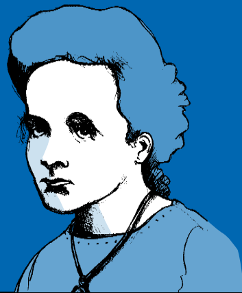
Marie Curie (1867-1934). Jatorri poloniarreko zientzialari frantsesa.

« Egin duzunaz ez zara inoiz ohartzen; oraindik egiteko duzuna baizik ez duzu ikusten »