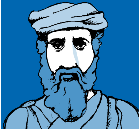
Pitagoras (Ka VI. mendea). Greziar matematikaria.

« Ordenaz eta denboraz baliatzean datza dena egiteko ez ezik ondo egiteko sekretua »»